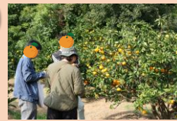
ペアでミカン狩り