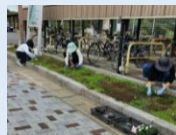
川棚温泉駅 国道側