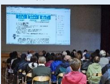
総合支所より説明

豊浦総合支所、自治会連合会、まちづくり協議会の共催で防災救急訓練が、宇賀小学校で開催されました。