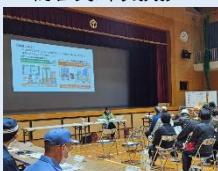
まち協のプレゼン