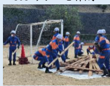
テキパキと救出活動