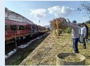
川棚温泉駅 旧ホーム側