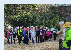
石川庄屋旧宅跡にて