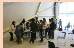
PR タイム 真剣!