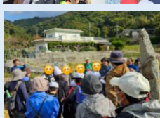
湯玉在の庚申塚にて